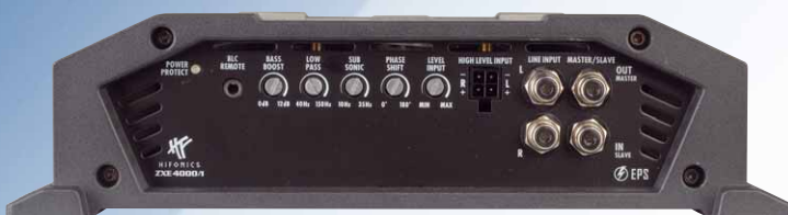
Reichhaltige Features von der Fernbedienung bis zur Einschaltautomatik. Die gut befestigten Cinchbuchsen erlauben auch den Master/Slave Betrieb mit zwei Verstärkern

moderner Kompaktverstärker. Und das beste daran: Die ZXE4000/1 kostet gerade mal 400 Euro, das ist sehr günstig für ein Markengerät mit dieser Ausstattung. Denn daran spart Hifonics ja nie, so hat auch die ZXE4000/1 ein ganzes Arsenal an Features mitbekommen. Angefangen bei der Fernbedienung über die weiß/blau umschaltbare Beleuchtung bis hin zu den Filtern, die Tiefpass, Bassboost, regelbare Phase und Subsonic umfassen, ist die ZXE vollständig ausgestattet. Und auch