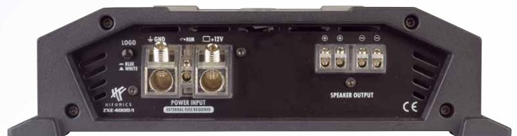
Druckgussrahmen, massive Terminals für große Kabelquerschnitte und eine umschaltbare Beleuchtung